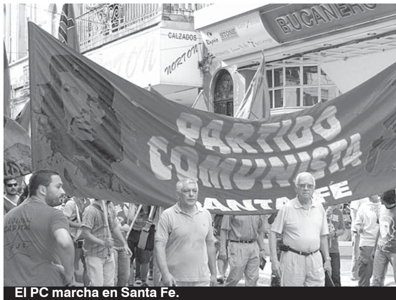
El PC marcha en Santa Fe.

Ha sido una victoria dura, peleada, pero victoria al fin y eso se pudo palpar en los miles de rostros y ojos de los militantes que se abrazaban y unificaban la consigna, "cárcel, co-